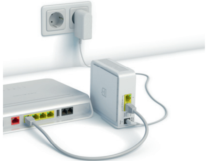
Basic / Classic Router (Beispielabbildung)

Schließen Sie das Netzteil erst an die AirTies-Funkeinheit an und verbinden Sie es dann mit der Steckdose. Schalten Sie die AirTies-Funkeinheit ein.