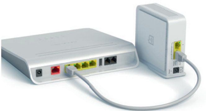
Basic / Classic Router (Beispielabbildung)

Entfernen Sie zuallererst die Kunststoffabdeckung von Ihren Geräten vor der Installation.